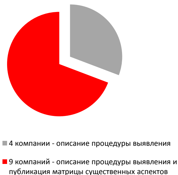
Описание существенных аспектов

интегрированные отчеты, декларировали приверженность принципу существенности.